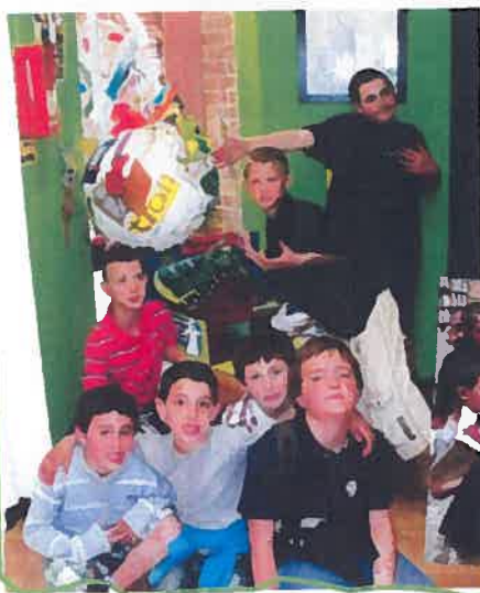
Les enfants du groupe coccinelle et du Sessad Mosaique