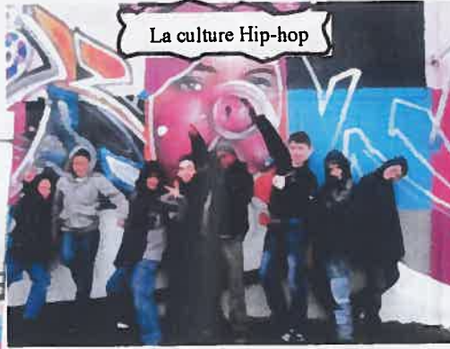
La culture Hip-hop