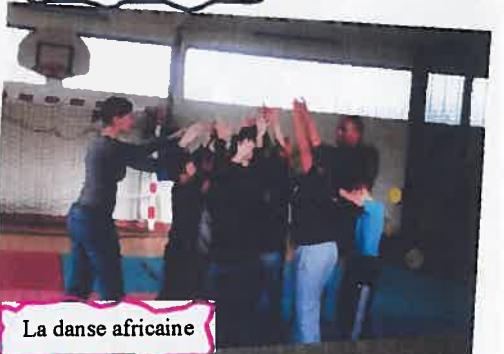
La danse africaine